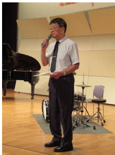
増田副会長から活動状況報告

今回は、昨年続く2回目の開催でしたが、ニュータウン自治会の行事としてすっかり定着しているように感じました。これからも皆さんの地域活動はますます活発になり、更に絆が深まっていくことでしょう。