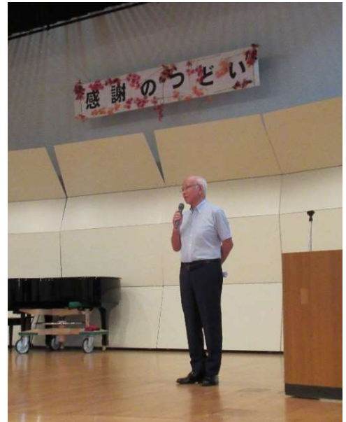
池原会長の代表挨拶