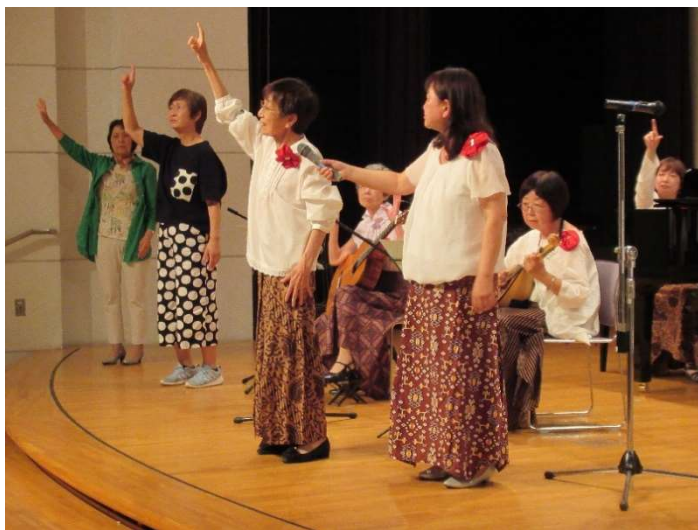
♪上を向いて歩こう♪を手話で