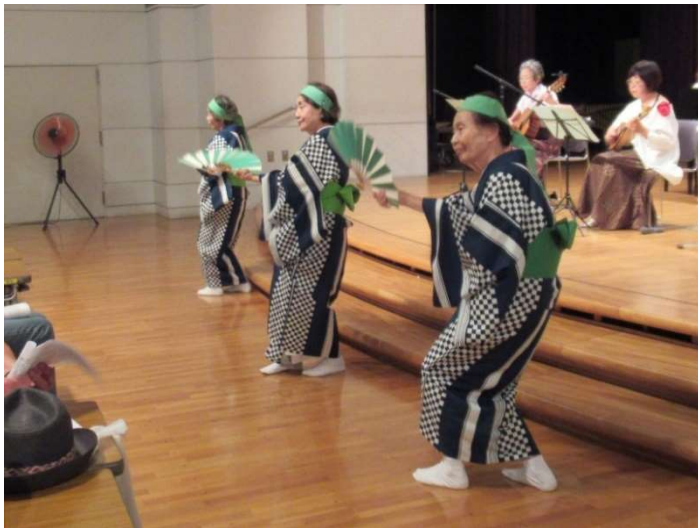
♪ボケない小唄♪の歌声に乗って「すみれ会」の踊り