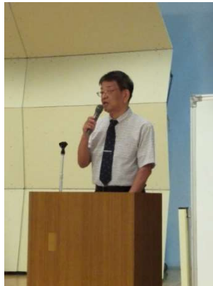
司会の増田副会長